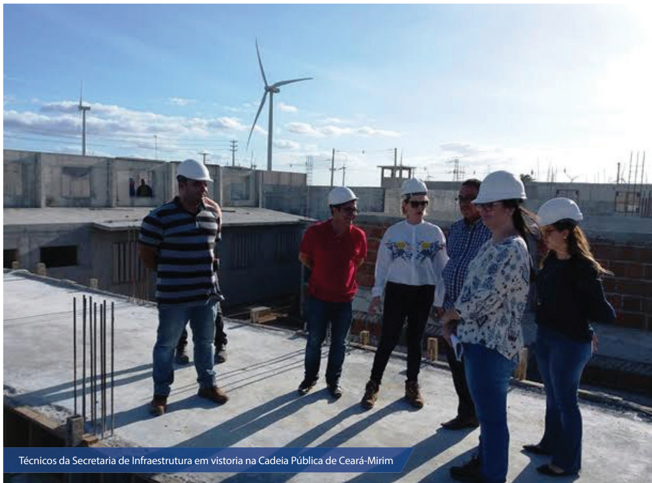
Técnicos da Secretaria de Infraestrutura em vistoria na Cadeia Pública de Ceará-Mirim

Com capacidade para 603 novas vagas, a Cadeia Pública de Ceará-Mirim, quando pronta, irá diminuir, parcialmente, o déficit do número de vagas no Sistema Penitenciário do RN.