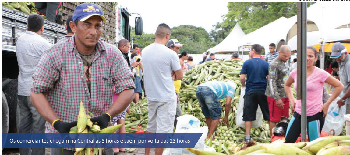
Os comerciantes chegam na Central as 5 horas e saem por volta das 23 horas

A Feira do Milho da Central de Comercialização da Agricultura Familiar segue até o próximo dia 1º de julho no cruzamento da Rua Jaguarari e Avenida Capitão Mor Gouveia, em Natal.